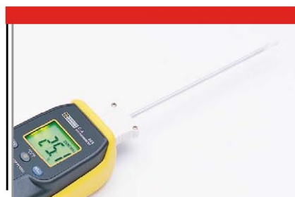
Suministrado con sonda Pt 100

Referencia Electrónica Embajadores: INR1565: C.A865